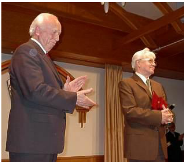
Sütő András, Mádl Ferenc Köztársasági Elnökkel

- Igazság szerint nekünk kellett volna elzarándokolni az ünnepelthez. Hadd, lássák minél többen, hogy kicsoda nekünk Sütő András. El kellett volna mennünk Pusztakamarásra, a szülőházhoz, a templomba, ki a temetőbe, Nagyenyedre az ősi kollégiumba, aztán tovább Kolozsvárra, Farkaslakára, Marosvásárhelyre, fölkeresni azt a megjelöletlen helyet, ahol 1990 március 19-ének vérszomjas éjszakáján fejszések ütöttek. Ez a hely olyan marad, mondta az író, mint a Segesvárhoz közeli Fehéregyháza, ahol utoljára látták Petőfi Sándort. Amikor az írás életveszélyessé válik, bizonyosak lehetünk abban, hogy az irodalom a könnyű csábítások ellenére sem fog elzúlleni.