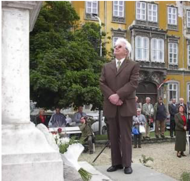
Tiszteletadás a Hűségzászlónál