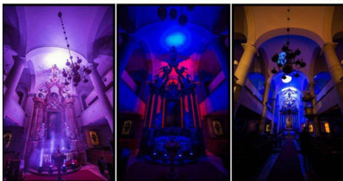
Fidelissima Vegyeskar/Mike Arnold

A támogatásból felszerelési tárgyakra is költenek, de ennél fontosabb, hogy a pénzből szervezett programokon, táborokban olyan élményekhez juttatják a gyerekeket, amelyeket máskülönben nem élhetnének meg.