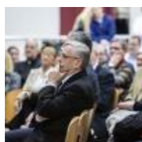
Kattinson egy képe a galériánk megtekintéséhez